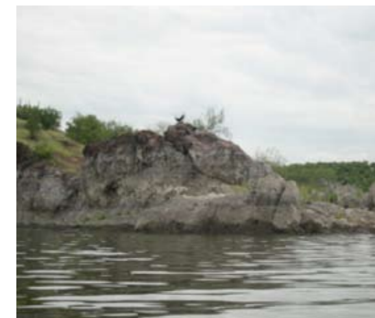
En estas puntas tuvimos éxito con los Senkos y los Grubs de 8"